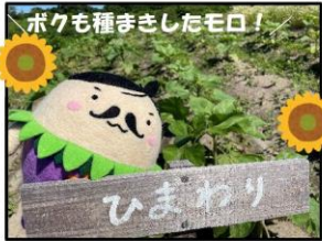
ボクも種まきしたモロ!

皆さんご存じでしたか? 緑の郷では、雲海が見られます!! 運が良ければ見られる宿泊された方の特権です🌟