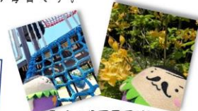
町内の公園見回りに行ってきたモロ

5月12日(木) 仙台女子プロレスの皆さんが大郷町で田植えをしに来てくれたモロ。選手の皆さん、スタッフや地域の皆さんと楽しい時間を過ごしたモロ♪