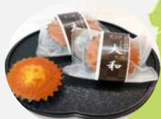
大和町 マドレーヌ