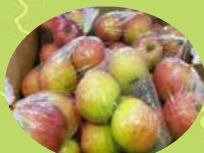
大衡村 いんごなど