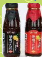
利府町 利府梨を使った 焼肉のたれ