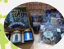
七ヶ浜 海産物セット