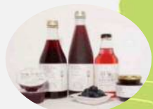
富谷市 フルーツジュース他