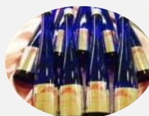
多賀城市 おもわく姫