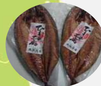
塩竈市 さばの一夜干し