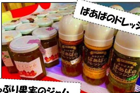
ぼあぼのドレッシング

さらに、野菜をたっぷり使用したドレッシングや麺や野菜を使用した味噌「やまんぼ味噌」等新商品を研究開発しており、道の駅おおさとで好評販売中です！