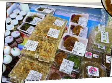
焼きおにぎり・おこわ