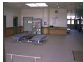
エントランスホール ⑤