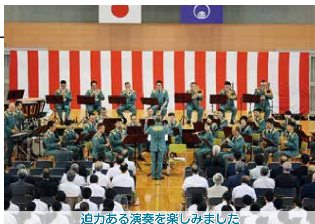
迫力ある演奏を楽しみました

当日は、クラシックからポップス、ゲームのテーマ曲まで親しみある楽曲が披露され、式典参加者や大郷中学校の全校生徒、町民の方々など総勢700人余りが音楽隊の迫力あふれる生の演奏を楽しみました。