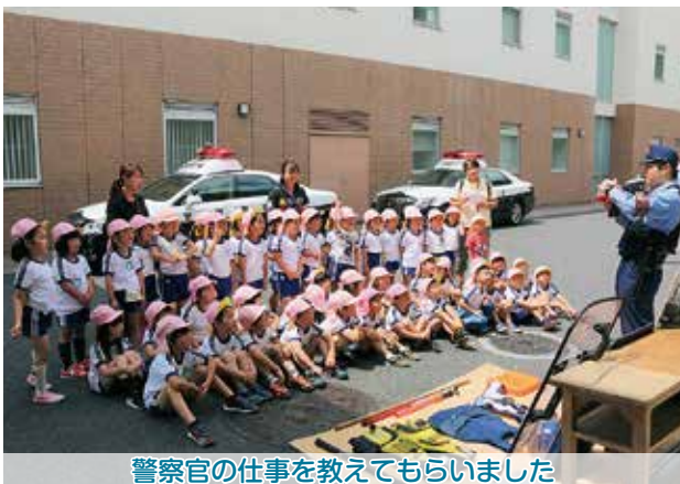
警察官の仕事を教えてもらいました