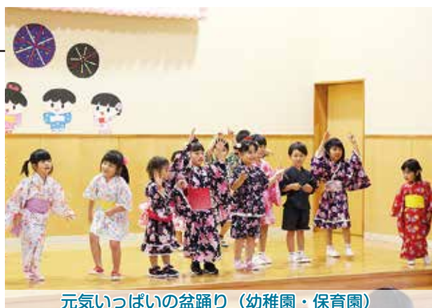
元気いっぱいの盆踊り（幼稚園・保育園）

園児たちはこの日のために練習してきた盆踊りを元気いっぱい踊り、お祭りを楽しんでいました。