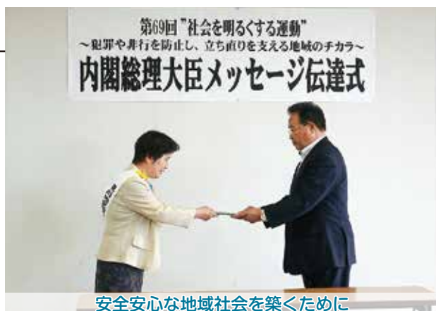
安全安心な地域社会を築くために

伝達式には町内の保護司と更生保護女性会のメンバーが参加し、犯罪・再犯の防止や立ち直りに向けた取組について、町と一団となって一層強力に推し進めることについて、決意を新たにしました。