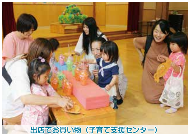
出店で買い物（子育て支援センター）