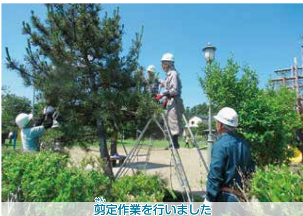
剪定作業を行いました