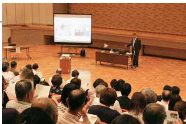
子どもの可能性づくりについて講演いただきました