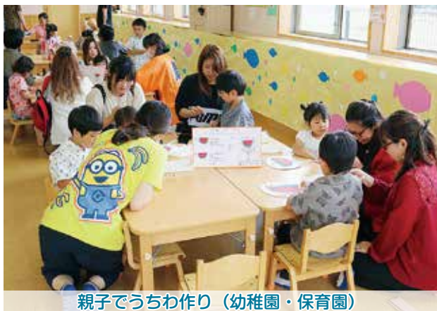
親子でうちわ作り（幼稚園・保育園）