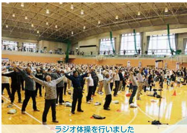
ラジオ体操を行いました