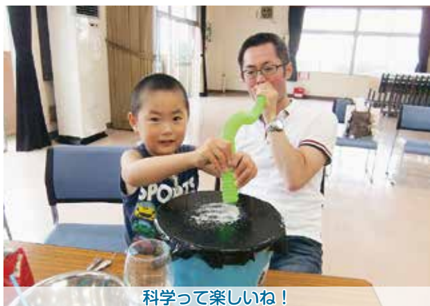
科学って楽しいね！