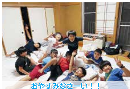
おやすみなさーい！！