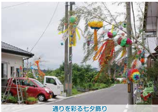
通りを彩る七夕飾り