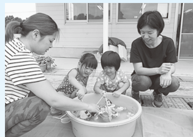
おふねを作っておそんだよ

日時：9月1日(金)・10月2日(月) 午前9時30分～11時30分 内容：お子さんを遊ばせながら、保護者同士おしゃべりを楽しんだり、お友だちと一緒に遊んだりできます。お子さんの手形をとったり身長体重を測ったりするコーナーもあります。