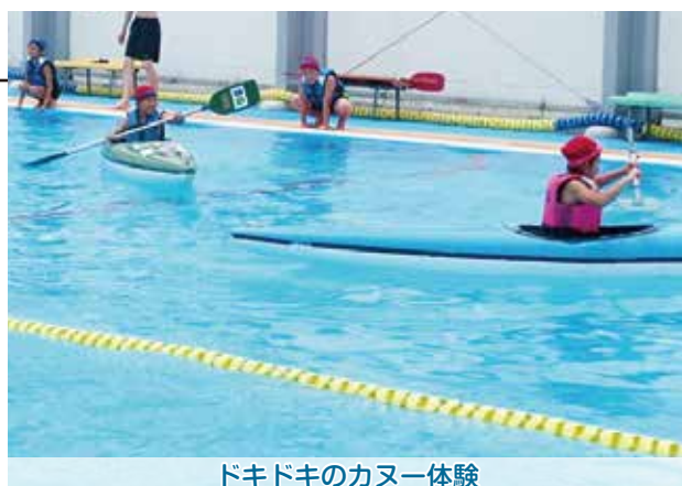
ドキドキのカヌー体験

カヌー体験では、まっすぐ進むことができず、クルクルと回り、落ちそうになりながらも楽しそうに漕いでいました。