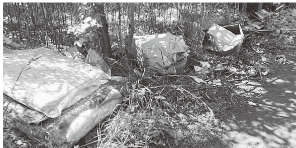
不法投棄された布団、ダンボール等