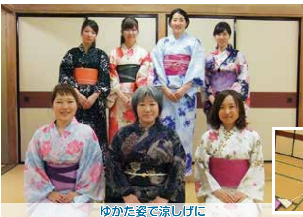
ゆかた姿で涼しげに