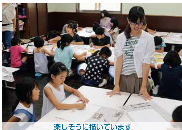
楽しそうに描いています

お絵かきの時間に子どもたちは、「夏」をテーマに花火やカブトムシ、すいかなどを描き、みんなで楽しい時間を過ごしました。