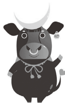
全共宮城大会マスコットキャラクター 牛政宗(うしまさむね)

問 第11回全国和牛能力共進会宮城県実行委員会事務局 ☎714-2982 http://www.zenkyo-miyagi.com/