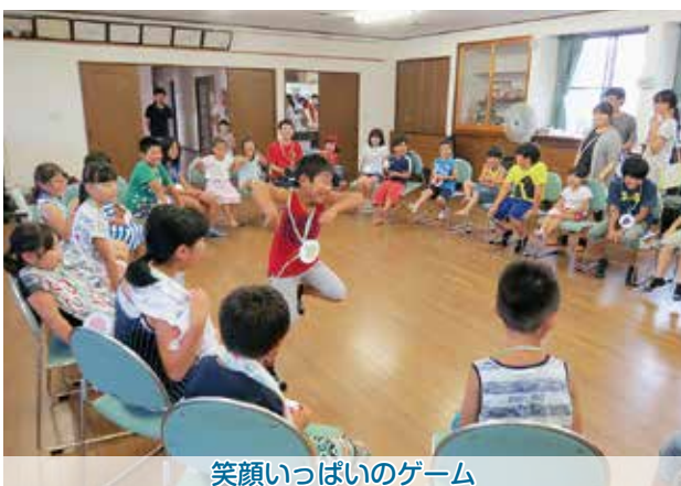
笑顔いっぱいのゲーム