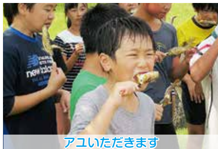
アユいただきます