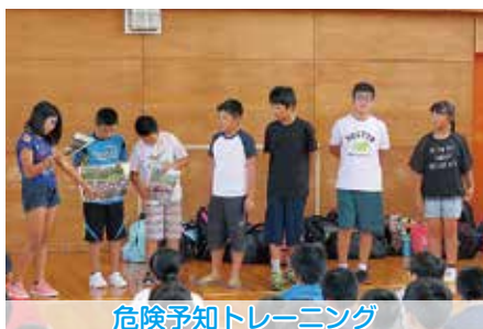
危険予知トレーニング