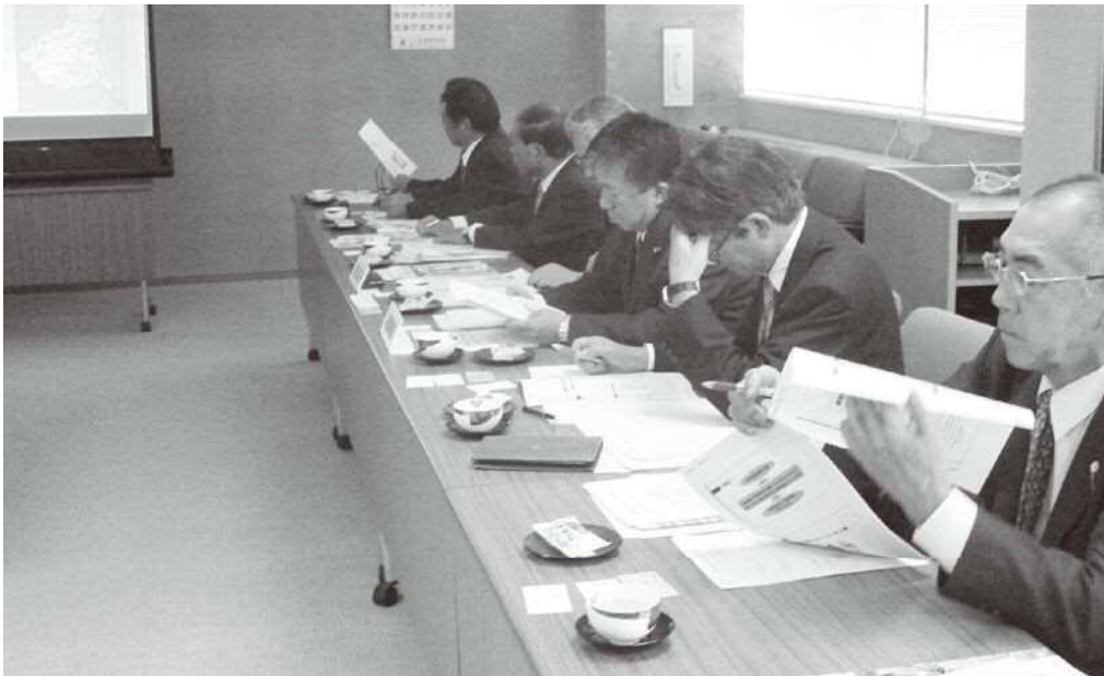
▲更なる「町民福祉の向上」を！（茨城県東海村視察時）