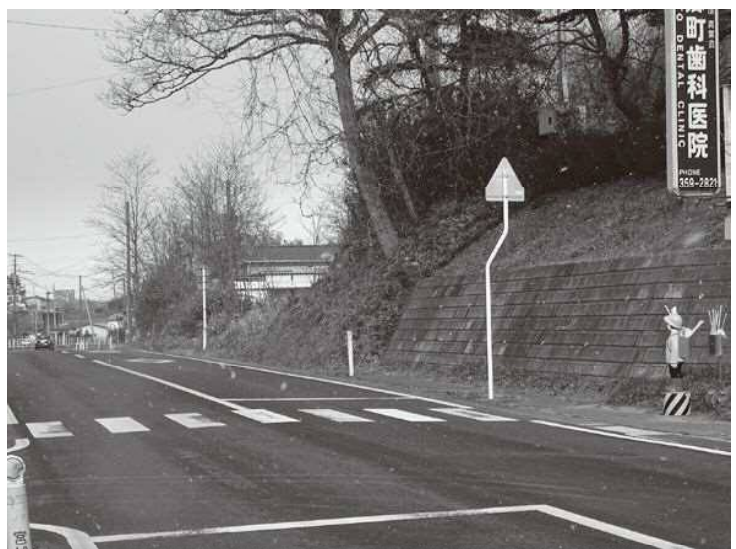
▲安全ですか？その通学路

問 視覚障害者への配慮は。 答 町長 点字で「マイナンバー通知」と表示、専用読み取り機やスマートフォン等で読み取りすることで、簡単な説明を音声で行う対応となっている。