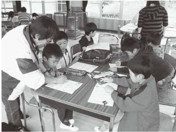
▲放課後子ども教室「郷子舎」の授業風景