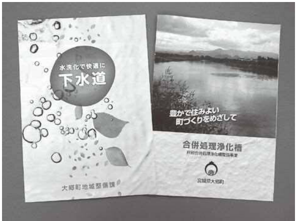
▲さらなる水洗化率向上を