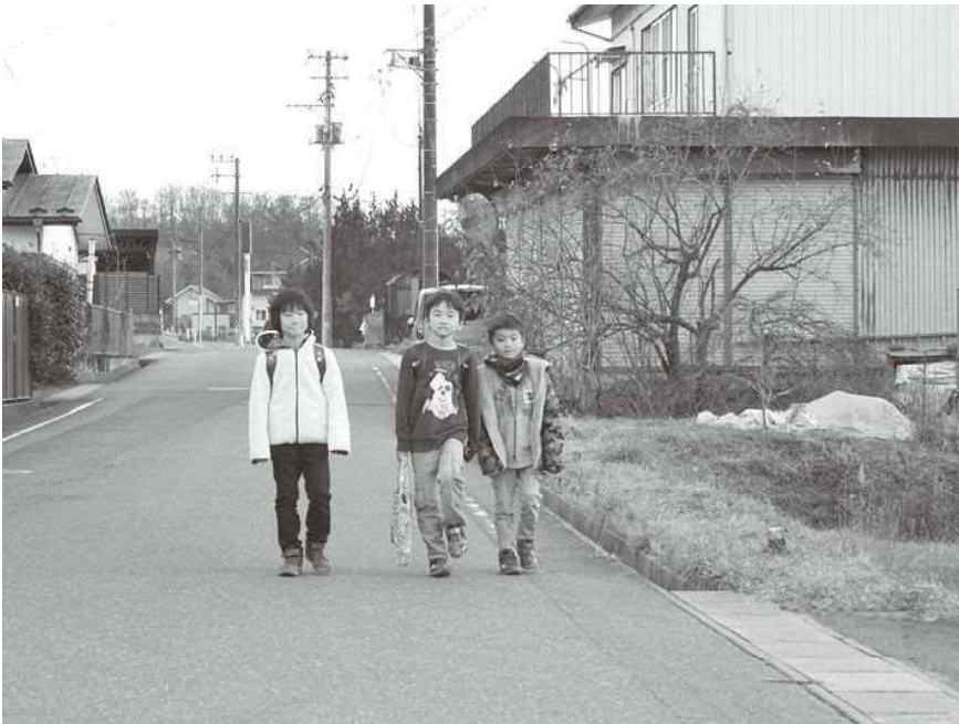
▲車輦の増加による事故が懸念される通学路