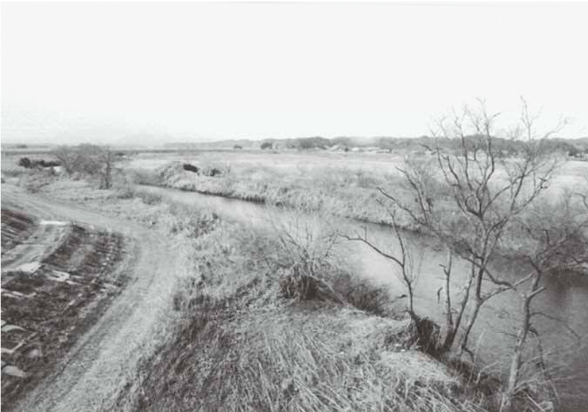
▲災害対策を早急に！