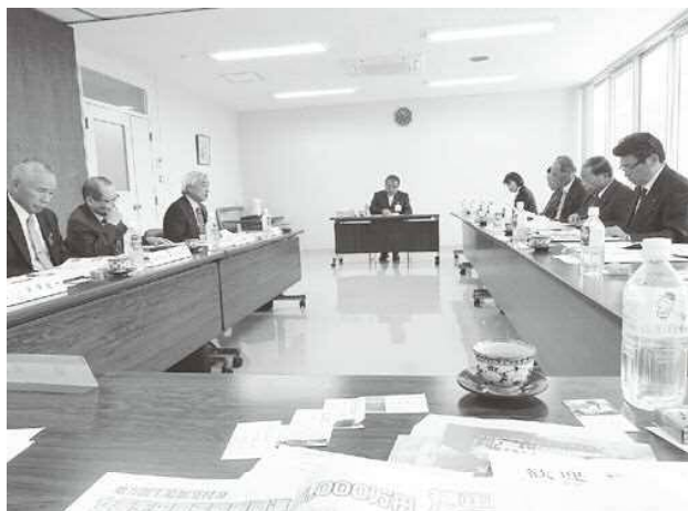
▲議会活動をリアルタイムで配信

である。勉強、反省を繰り返し、町民に、さらに読んでいただく広報の作成、そのための編集の垂直立ち上げを全員で決意した研修であった。