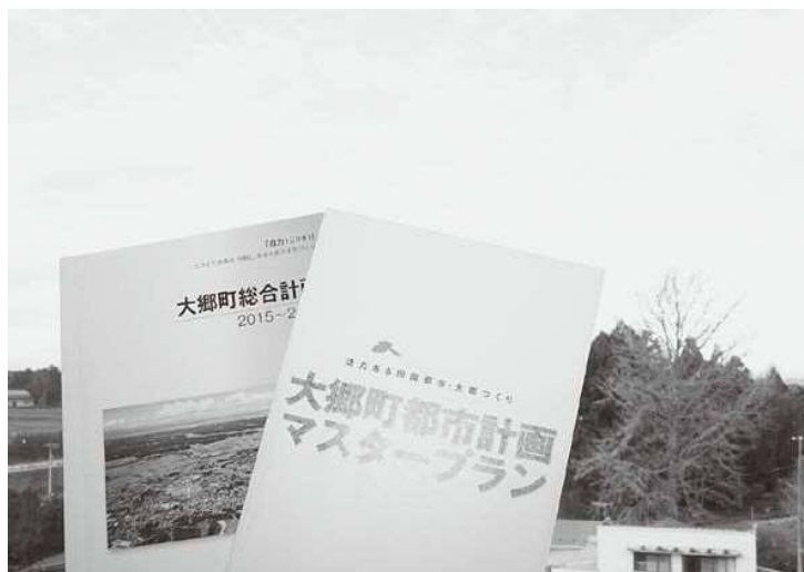
▲今後の町の活性化と発展指針

たいだ市と市がつながれば、3桁国道昇格の可能性がある。塩竈市長などと組織を立ち上げ運動していく。