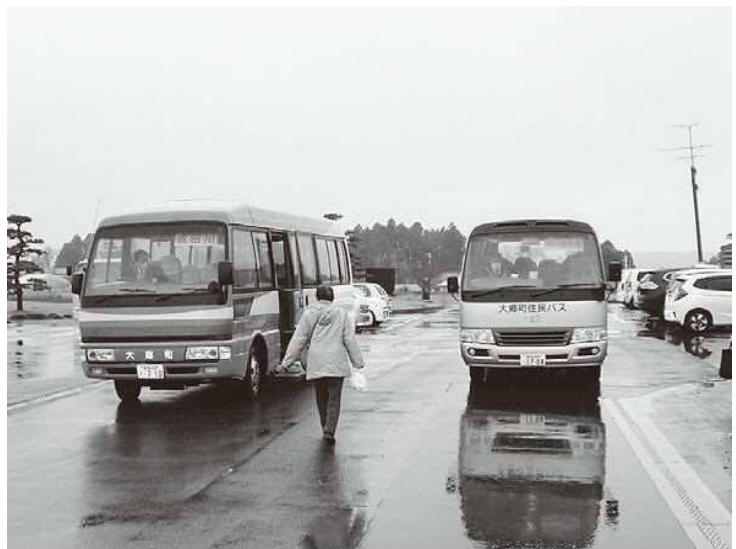
▲利用者主体の住民バスに

など小学校就学時支援の拡充を図っては。 答 町長 保護者や地域からランドセル支給についての要望も出ていないので支給する考えはない。