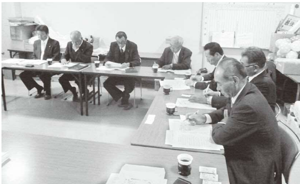
▲地域農家が抱える諸課題の解決を（農事組合法人となん視察時）