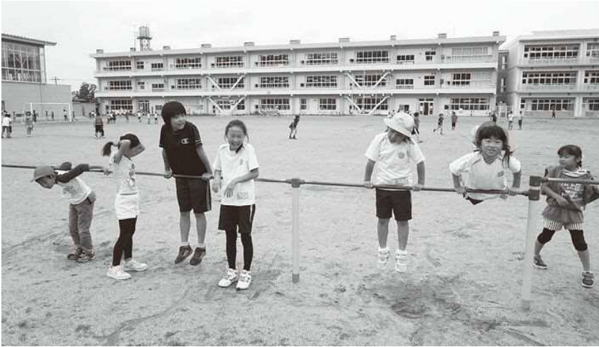
▲笑顔が溢れる学校生活