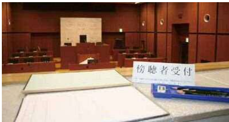
▲定例議会の日程などについては、議会事務局へお問い合わせください