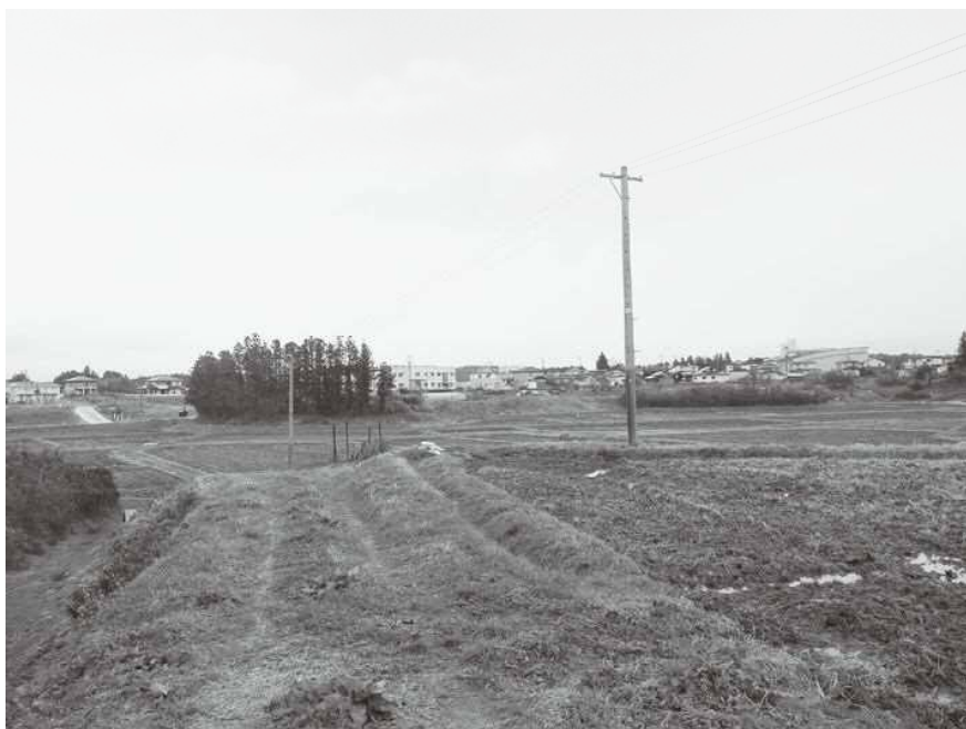
▲市街化形成候補地に？（写真右側約6ha）