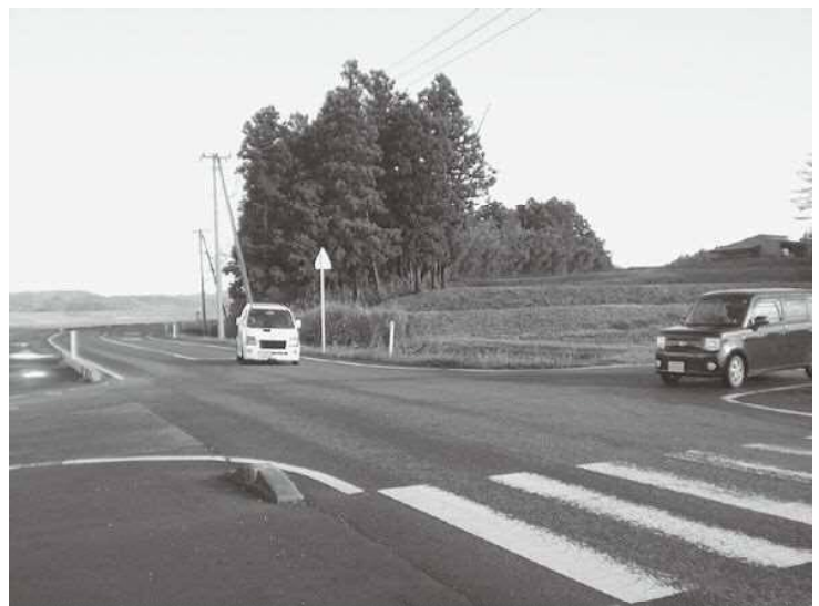
▲危険な交差点の早期改善を