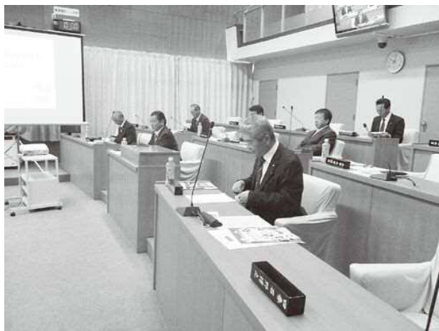
▲より多くの町民に読んでもらうために活発に意見交換

期待される。本町においても議会活動をリアルタイムで伝えるインターネット中継配信の必要性を痛感させられた研修であった。