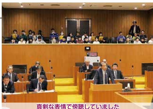
真剣な表情で傍聴していました

児童は初めて入る議場の雰囲気に対し少し緊張した様子でしたが、一般質問をする議員と答弁する町長の町政に関するやり取りを集中して聞き入り、気づいたことを熱心に書き留めていました。議場から出てくると「話し合いがすごかった」と圧倒されていた児童もいれば、初めて見る議会は「おもしろかった」という児童もいました。