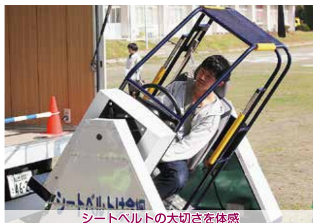
シートベルトの大切さを体感