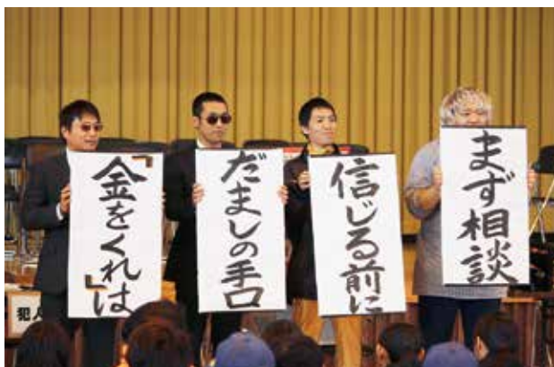
寸劇でオレオレ詐欺の手口を再現