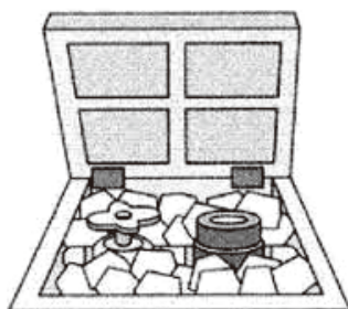
発砲スチロールや新聞紙をつめてください