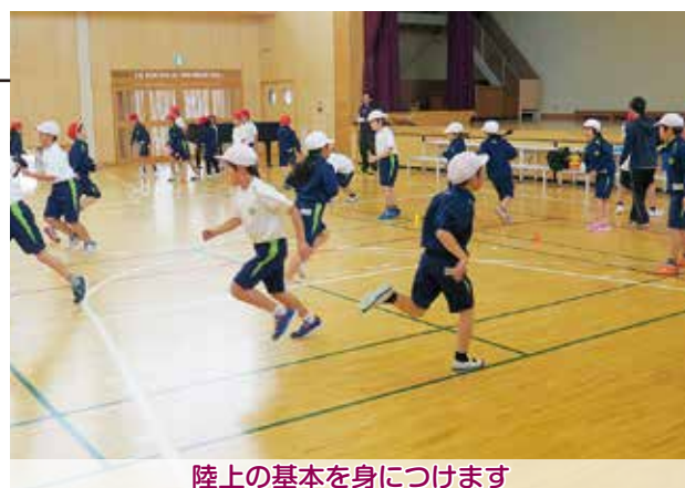
陸上の基本を身につけます

児童は講師の話真剣に聞き、太ももを上げて腕を大きく振る動作や視線は真っすぐに頭を動かさない意識を持つことなど陸上競技の基本を教わりました。講師がお手本を示すと児童の歓声が沸き、自分たちも上手にできるよう熱心に取り組んでいました。