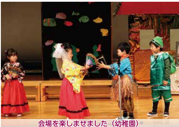
会場を楽しませました（幼稚園）