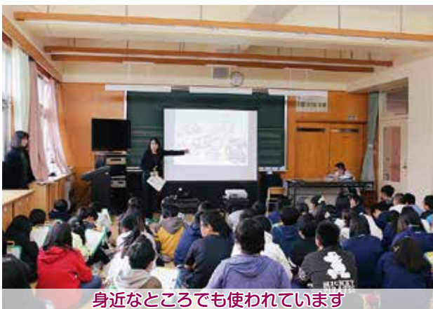
身近なところでも使われています