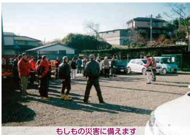
もしもの災害に備えます