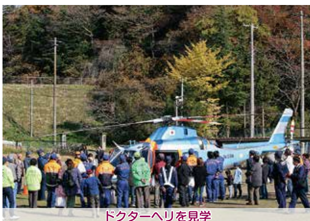
ドクターヘリを見学

安全講話では夕暮れ時の交通事故防止のため「ラ・ラ・ラ運動」や反射材の活用が呼び掛けられました。大郷中学校吹奏楽部と宮城県警察音楽隊による演奏、ドクターヘリの離着陸、大和警察署の方々によるオレオレ詐欺防止の寸劇も行われ、参加者は交通安全の意識を高めました。