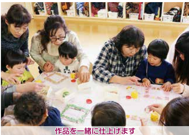
作品を一緒に仕上げます