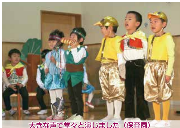
大きな声で堂々と演じました（保育園）