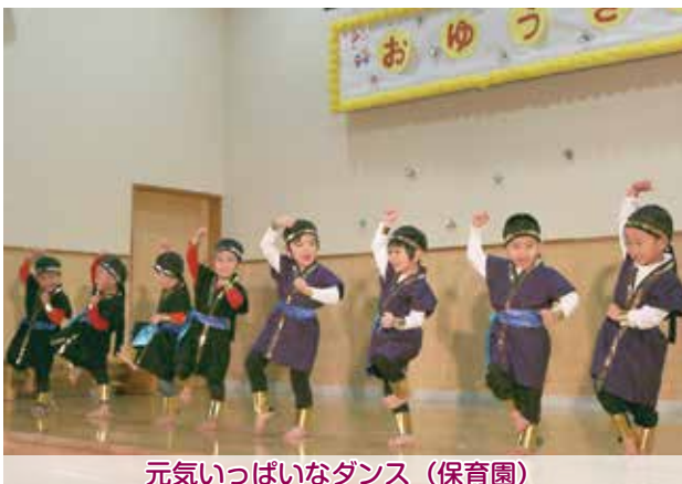
元気いっぱいなダンス（保育園）

園児が一生懸命表現する姿に、会場からはたくさんの拍手が送られ、おゆうぎ会は大成功のうちに幕を閉じました。