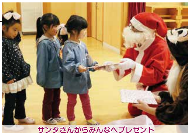
サンタさんからみんなへプレゼント

楽しみにしていたサンタさんからのプレゼントに園児たちは満面の笑みを浮かべていました。