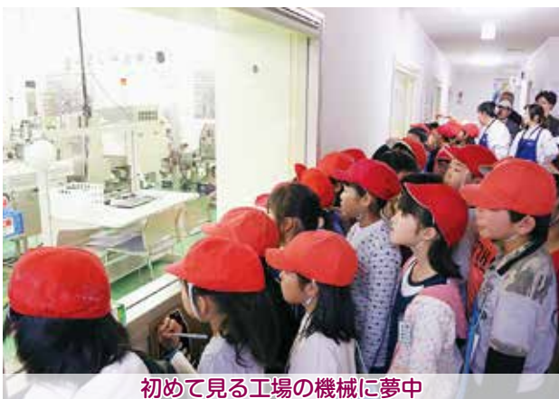
初めて見る工場の機械に夢中