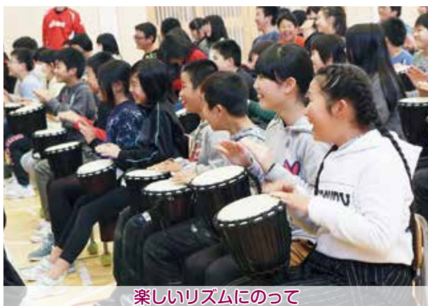
楽しいリズムにのって