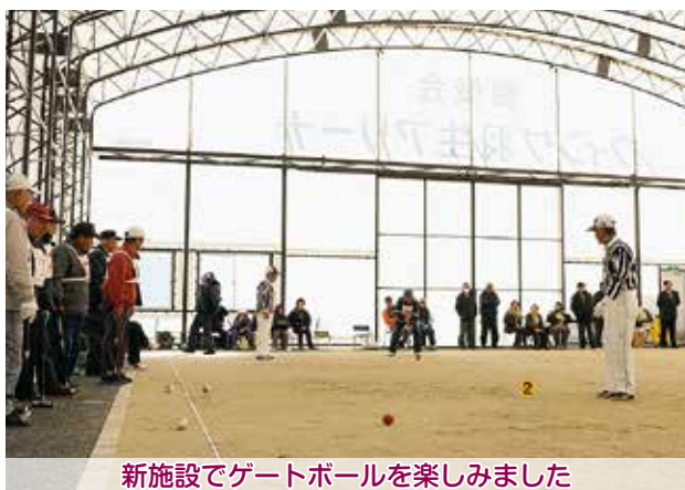
新施設でゲートボールを楽しみました