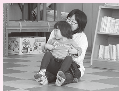
遊びの会 「いっぱい体を動かして遊ぼう！」