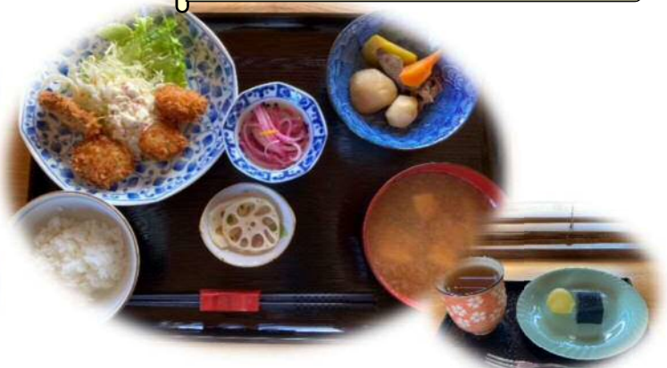
帆立と鱈のフライ (平日1,100円ミニデザート飲み物付)

自家栽培の野菜や大郷町産の旬な食材をふんだんに使用した日替わりメニュー (副菜2~3品付) と季節の手作りデザートが人気です。土日祝日は季節のデザート4種類の中から選ぶことができます。この日のデザートは、黒ゴマの寒天とブドウをいただきました。心も体も元気になるお店です。