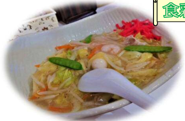
五目あんかけ焼きそば (850円)

各種定食、ラーメン、うどん、そばなど、メニューが豊富なお店です。その中でも店長のおすすめの一品が、この「五目あんかけ焼きそば」。あつあつの塩味のあんには、地元大郷町産の野菜が使われています。いつでも元気なスタッフのみなさんがお迎えしてくれる、明るい雰囲気のお店です。