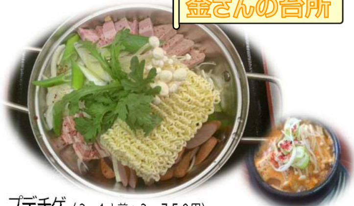
プデチゲ (3~4人前: 2,750円)

お店おすすめのパデチゲ (写真左) は肉・野菜・豆腐など一般的なチゲ鍋 (写真右) に、ソーセージやスパム、インスタントラーメンを加えて煮込んだ鍋料理です。お店のパデチゲは辛さが控えめなため、子どもから大人までみんなで楽しめます。本格的な韓国料理が食べられるのが特徴のお店です。他のお料理も、辛さは調整してくれますよ。