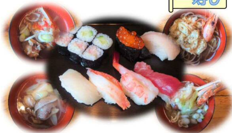
にぎり寿司・汁物セット (1,300円~)

お寿司のネタも、汁物も、季節の食材を使用しています。海老そば (右上)、渡り蟹のお味噌汁 (右下)、吉次のあら汁 (左上)、鴨汁 (左下) など、素材のうまみがたっぷりの汁物をいただけます。固定メニューはなく、お客さんからのリクエストで作ることもあるそうです (2、3日前までに要連絡)。