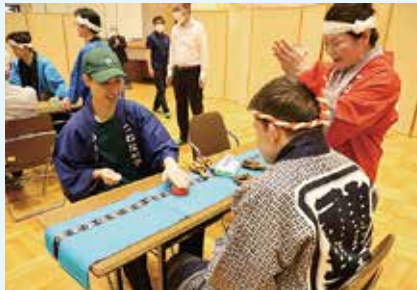
▲お座敷遊びを楽しみました