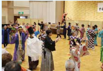
▲参加者全員で盆踊り体験