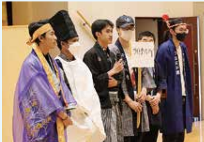
▲自己紹介をする参加者

午後の部では、日本舞踊など文化芸能の鑑賞やお座敷遊びなどを楽しみ、全員で盆踊りを体験して参加者同士交流を深めました。