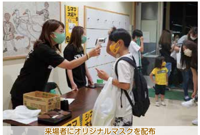
来場者にオリジナルマスクを配布