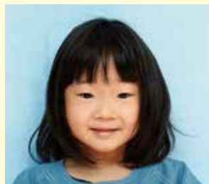
やない のあちゃん (鶺崎) わたしのゆめは 「アイス屋さん」