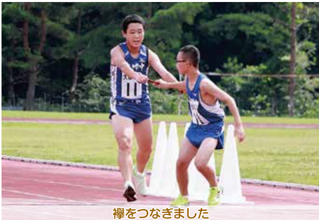
襷をつなぎました