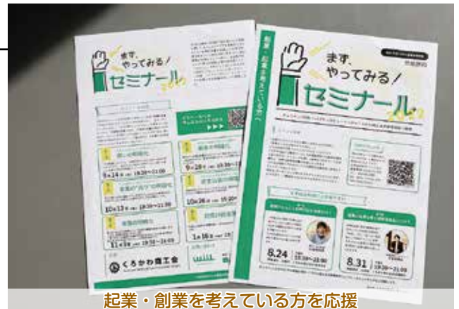
起業・創業を考えている方を応援

全6回、9月から1月まで無料開催されるゼミナールでは、創業計画書を作成しながら起業を前進させることを目指します。