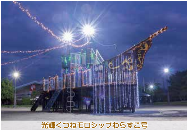
光輝くつねモロシッパわらすこ号