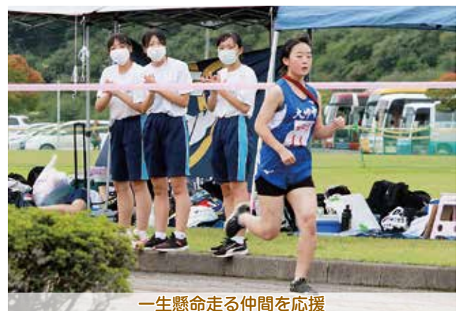
一生懸命走る仲間を応援