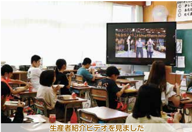
生産者紹介ビデオを見ました