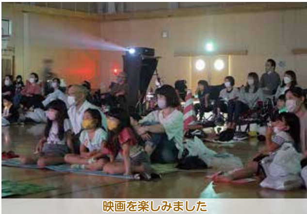
映画を楽しみました