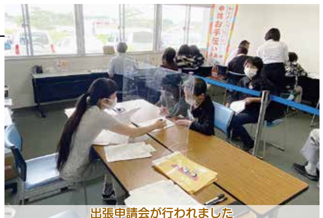
出張申請会が行われました

臨時的に開設されたブースでは、マイナンバーカードを初めて申請される方を対象に、申請に必要な顔写真の撮影と申請書の記入サポートが行われ、93名の方がマイナンバーカードの申請手続きを完了しました。普段、役場に出かけることが難しい方にも、気軽に立ち寄って申請することができる機会となり、参加した方からは「申請方法が分からなかったので、とても良い機会だった」という声が聞かれました。