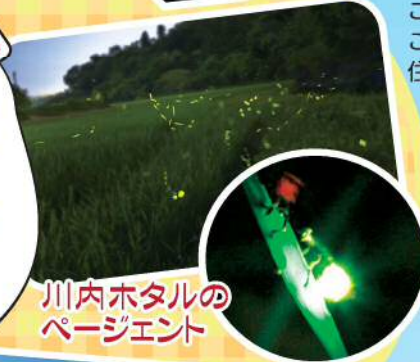
川内ホテルのページェント