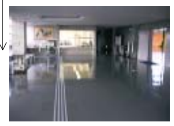
インタランスホール