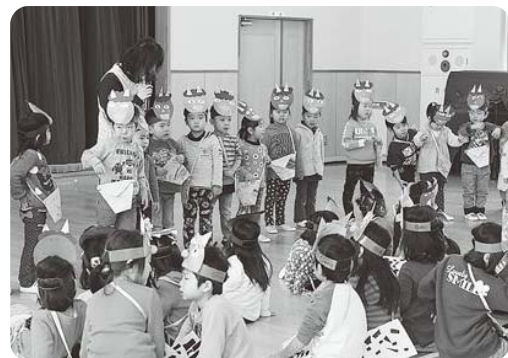
手作りのお面とますを披露（保育園）

園児は、手作りしたお面やますを身に付け、元気に「鬼は外！福は内！」のかけ声にあわせて豆をまき、自分の心の中にある泣き虫鬼や怒りんぼう鬼、忘れんぼう鬼など、それぞれが悪い鬼を退治しました。