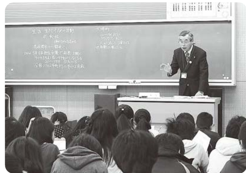
瀬戸副町長による授業

町が消滅したらどうなるか、少子高齢化などの現在の課題や具体的な取り組みが説明され、児童はメモを取りながら真剣に授業を受けていました。