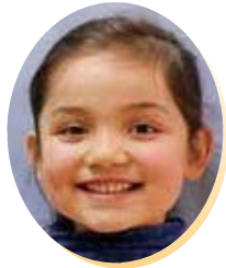
たどころ ゆんちゃん (味明) わたしのゆめは 「マッサージ屋さん」