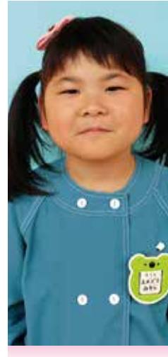
えんどう みぞらちゃん (中村) わたしのゆめは 「漫画家」