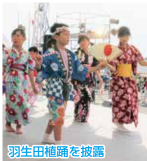
羽生田植踊を披露