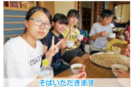
そばいただきます