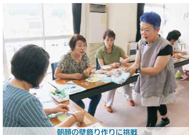
朝顔の壁飾り作りに挑戦