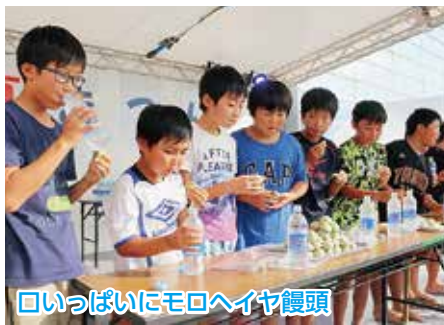
口いっぱいモロヘイヤ饅頭