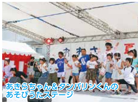
あきらちゃん&タンバリンくんのあそびうたステージ