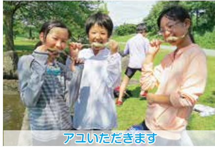
アユいただきます