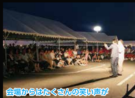
会場からはたくさんの笑い声が