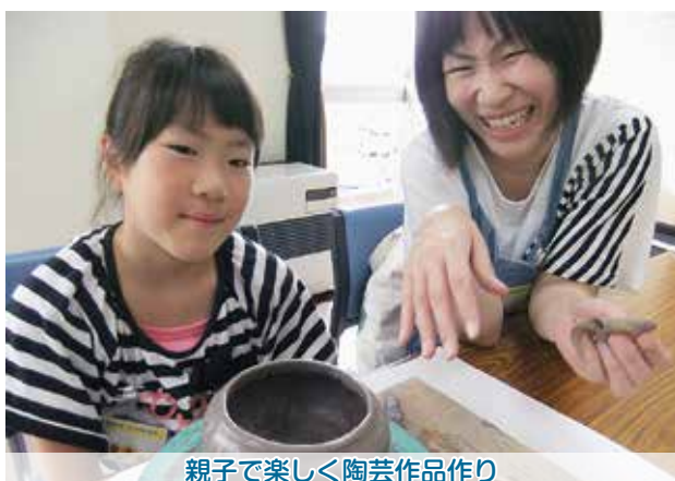
親子で楽しく陶芸作品作り

1日：たまごの学校では、たまごの殻を使って、タコやスイカなどの作品を完成させました。