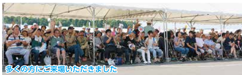
多くの方にご来場いただきました