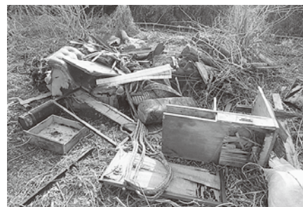
不法投棄された机、ソファ等