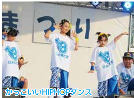
かつこいいHIPHOPダンス