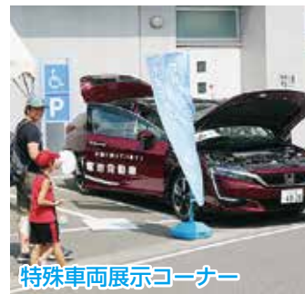
特殊車両展示コーナー