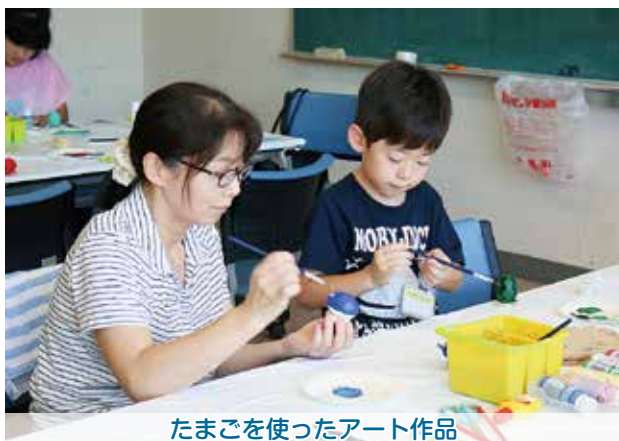
たまごを使ったアート作品