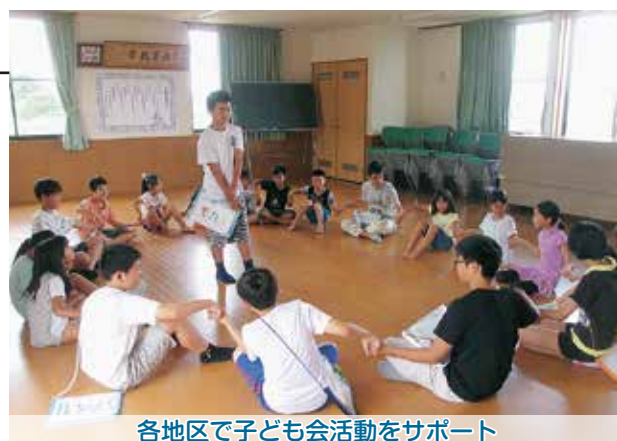
各地区で子ども会活動をサポート

また、7月から8月の夏休み期間中、各地区（成田川・山崎・味明・羽生・中村）の子ども会の活動をサポートしました。参加した子どもたちは安全に楽しく活動することができ、ジュニア・リーダーが大活躍した夏でした。