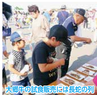
大郷牛の試食販売には長蛇の列