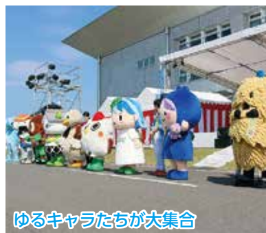
ゆるキャラたちが大集合