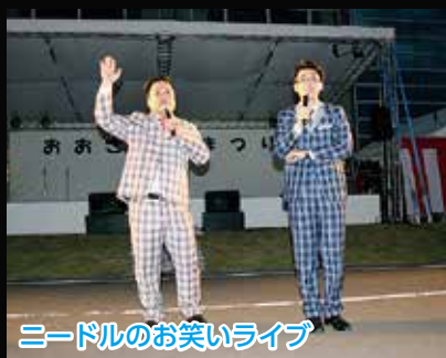
ニードルのお笑いライブ