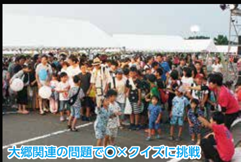
大郷関連の問題で〇×クイズに挑戦