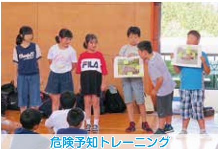
危険予知トレーニング