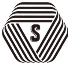
厚生労働大臣認可

標準営業約款制度は、法律で定められた消費者(利用者)を擁護するための制度です。 厚生労働大臣認可の約款に従って営業することを登録した「理容店」「美容室」「クリーニング店」「めん類飲食店」では、店頭でSマークを掲げており、安心・安全・衛生を約束する信頼できるお店です。