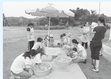
『水あそび楽しいね!』

内容：お子さんを遊ばせながら、保護者同士おしゃべりを楽しんだり、お友だちと一緒に遊んだりできます。お子さんの手形をとったり身長体重を測ったりするコーナーもあります。