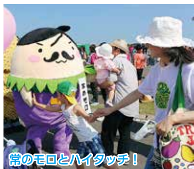
常のモロとハイタッチ！